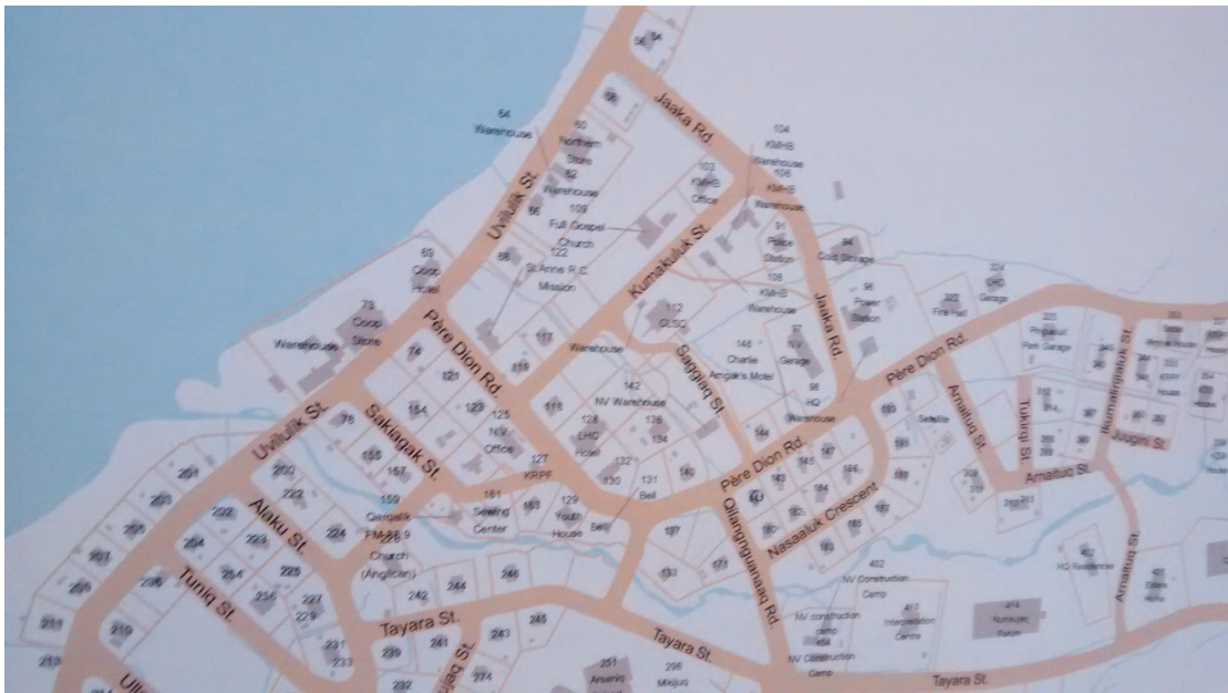
Nouvelle carte géographique du village de Kangiqsujaq où l'on voit le chemin, Père Dion Rd. , nommé en son nom.